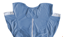
Pflegedecke ohne Ärmel - S254DD301

Vertrieb in Deutschland, Österreich und Schweiz durch: