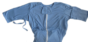
Pflegedecke mit Ärmel - S254DA301