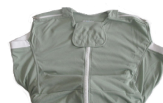
Pflegedecke für Kontrakturen - S254DC401